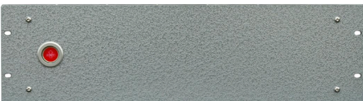
Power Supply Unit (PSU)